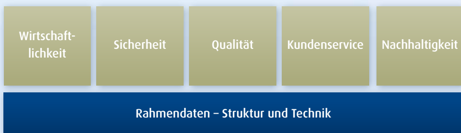
Abb.: Das Fünf-Säulen-Modell

Die Ergebnisse des Kennzahlenvergleichs werden in dieser Broschüre anhand vollständiger